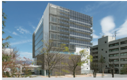
信州大学 国際科学イノベーションセンター 長野県長野市 | 2015年