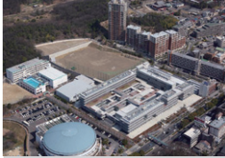
愛知総合工科高校 愛知県名古屋市 | 2016年