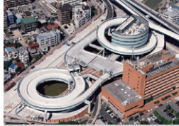
黒川ランプ 愛知県名古屋市 | 1996年