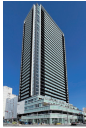
柳ヶ瀬グランドタワー 岐阜県岐阜市 | 2023年