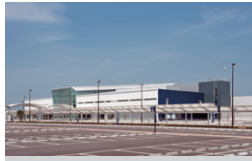
富士山静岡空港旅客ターミナル 静岡県牧之原市 | 2009年