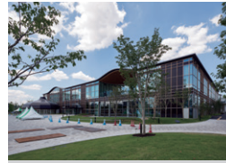
みんなの森ぎふメディアコスモス 岐阜県岐阜市 | 2015年