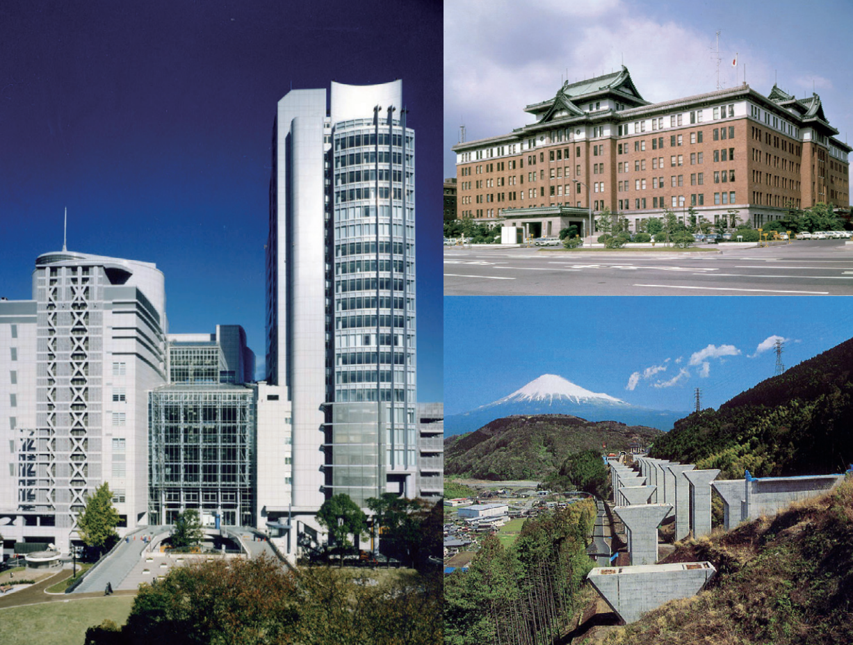
左：ナディアパークビジネスセンタービル（名古屋市 | 1996年）／右上：愛知県庁舎（名古屋市 | 1938年）／右下：第二東名高速道路富士川高架橋（静岡県富士川町 | 2003年）