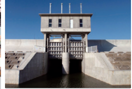
揖斐川城南排水機樋管改築工事 三重県桑名市 | 2014年