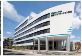
熱田リハビリテーション病院 愛知県名古屋市 | 2020年