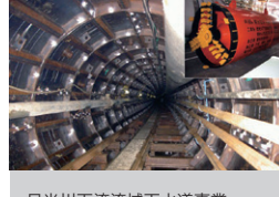
日光川下流域下水道事業 管きょ布設工事 愛知県海部郡 | 2007年