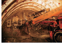
三遠南信久井田トンネル 静岡県浜松市 | 2008年