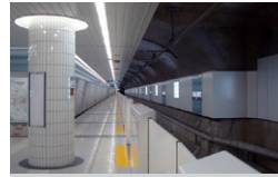
東京メトロ西早稲田駅新設 東京都新宿区 | 2008年