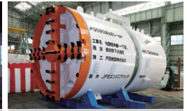
都下水道局中野一丁目、 中央二丁目枝線（シールド機） 東京都中野区 | 2010年