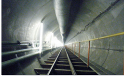
都下水道局中野一丁目、 中央二丁目枝線（竣工） 東京都中野区 | 2010年