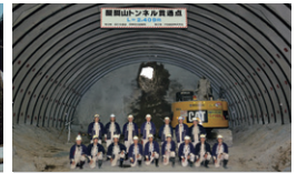
関東地整 中部横断醍醐山トンネル2 山梨県南巨摩郡 | 2014年