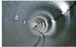
都下水道局 北区赤羽台三丁目付近再構築 東京都北区 | 2014年