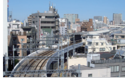
京急蒲田駅付近連立8工区 東京都大田区 | 2016年