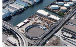
首都高生麦入口付替道路 神奈川県横浜市 | 2012年