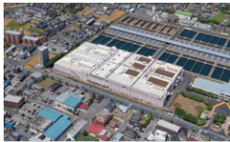
都水道局 朝霞浄水場高度浄水施設二期 埼玉県朝霞市 | 2014年