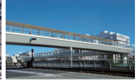
鎌倉市大船駅 西口ペDESTリアンデッキ 神奈川県鎌倉市 | 2011年