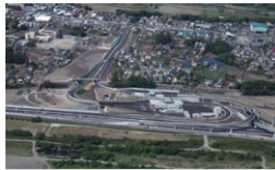
中日本道路圏中央厚木IC 神奈川県厚木市 | 2014年