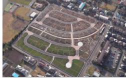
旭化成不動産レジデンス 袖ヶ浦宅地造成 千葉県袖ヶ浦市 | 2013年