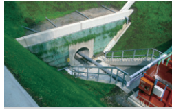
関東地整さがみ縦貫葉山島 排水トンネル 神奈川県相模原市 | 2014年