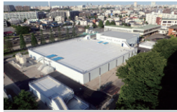
川崎市平間配水所調整池更新 神奈川県川崎市 | 2016年