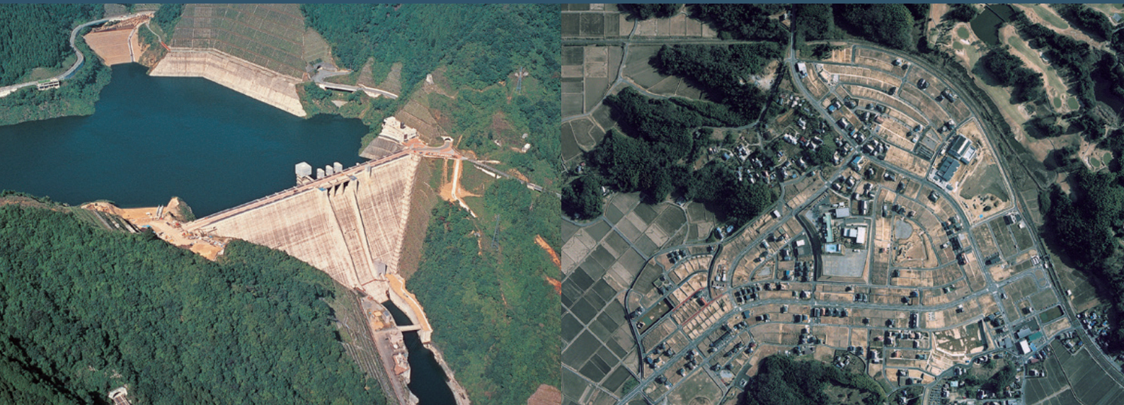
左：建設省宮ヶ瀬ダム（神奈川県津久井郡・愛甲郡 | 1997年）／右：成田市久住駅前土地区画整理組合自由が丘造成（千葉県成田市 | 2006年）