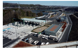
関東地整 さがみ縦貫相模原IC改良 神奈川県相模原市 | 2015年