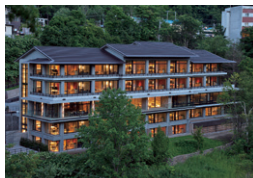
シャレーアイビー定山溪 札幌市 | 2019年