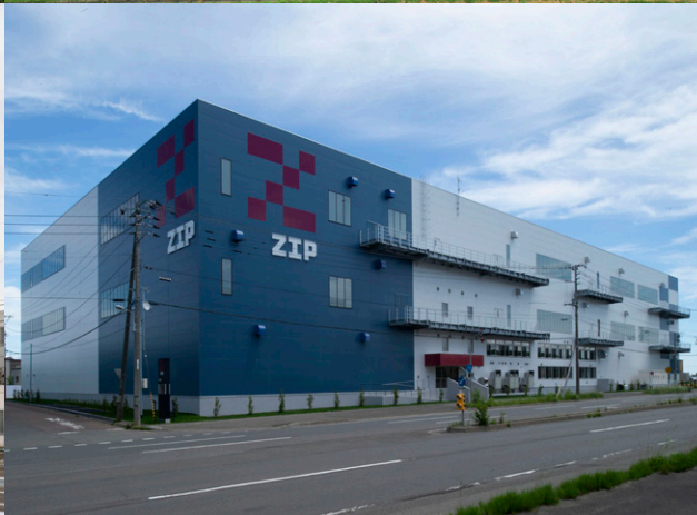
左上：道北風力川南 WF（稚内市 | 2023年）／右上：ロイズふと美新工場（石狩郡当別町 | 2022年） 左下：札幌円山整形外科病院（札幌市 | 2023年）／右下：ヴィーナス北広島物流センター（北広島市 | 2024年）