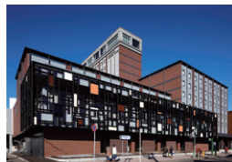
函館国際ホテル 函館市 | 2018年