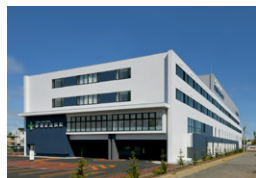
清和記念病院 札幌市 | 2022年