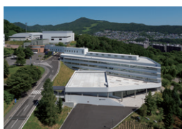
東海大学付属札幌高等学校 札幌市 | 2016年