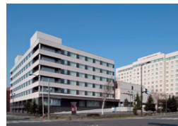
ANA クラウンプラザホテル千歳 千歳市 | 2017年