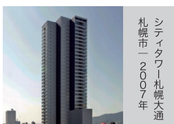
シテイタワー札幌大通 札幌市 | 2007年