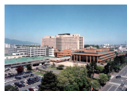
北海道大学医学部附属病院 札幌市 | 1997年