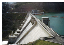
大野ダム 北斗市 | 2001年