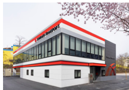
辛楽輸送本社 札幌市 | 2022年