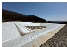
愛和産業北見処分場 北見市 | 2023年