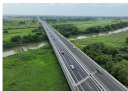
東日本道路夕張川橋床版 江別市 | 2023年