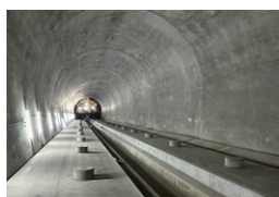
北海道新幹線 立岩トンネル 八雲町 | 2026年度予定