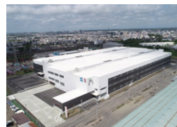
DPL 札幌レールゲート 札幌市 | 2022年