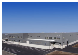
湧別漁協ホタテ加工工場 湧別町 | 2023年